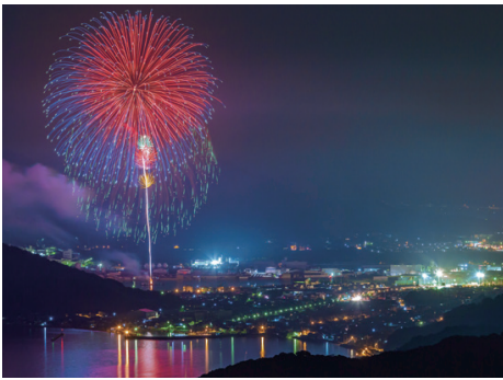
たくま港まつり

※当日の天候・海象により、旅程(航路、錨泊地、船外・船内体験を含む)が変更または中止となる場合がございます。