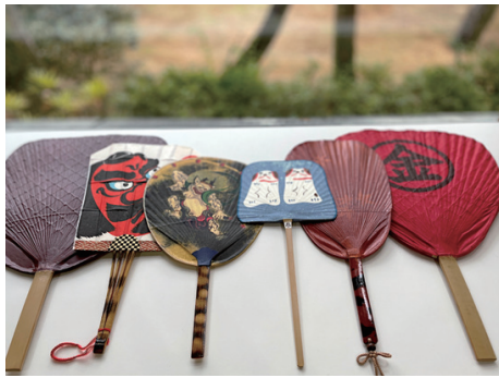
丸亀うちわ