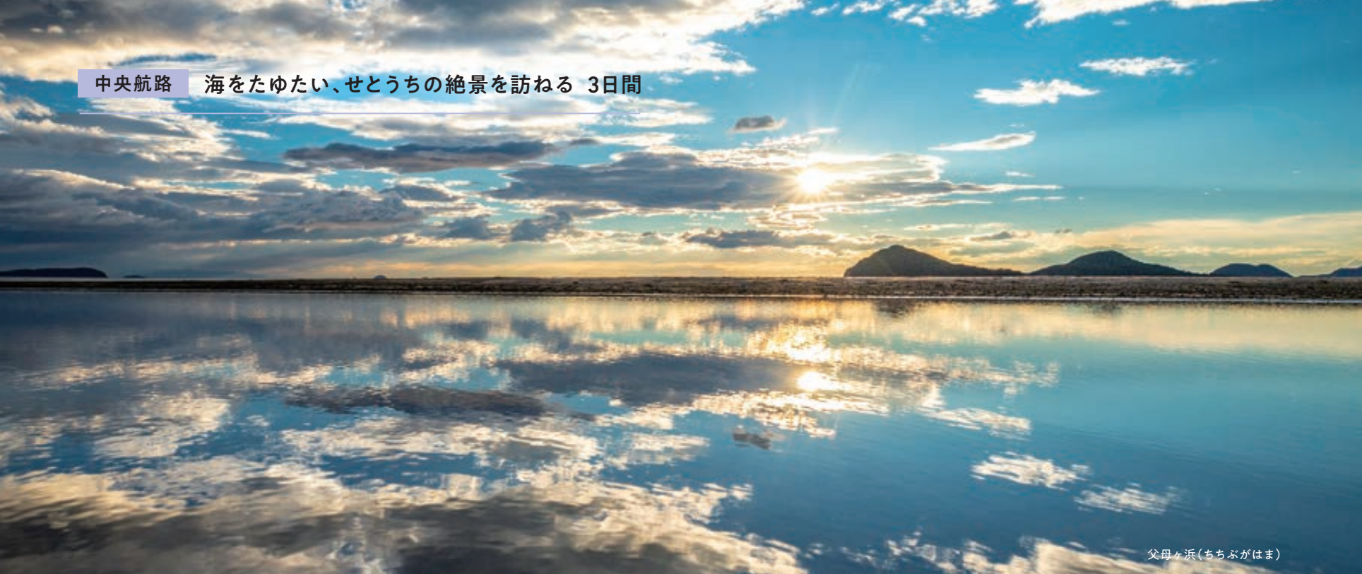
父母ヶ浜(ちちぶがはま)

尾道を中心に西は愛媛県の大三島、東は香川県の塩飽諸島まで大きく周遊するこの航路は、初日に複雑に入り組んだ芸予諸島の多島美を眺め、翌日、雄大に広がる燧灘を抜けて香川県沖までゆったりと進みます。船外体験では、凪いだ海面が鏡のように空を映し出す父母ヶ浜や、香川県の荘内半島にある標高352メートルの紫雲出山、小さな島の日常に溶け込む産業遺産など、その土地が生み出した印象的で大胆なせとうちの絶景へご案内します。日々移ろい、時季や気候で変化を続ける景色を、船上からとは異なる目線でお楽しみください。