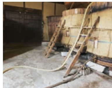
杉樽で仕込む伝統の仁尾酢