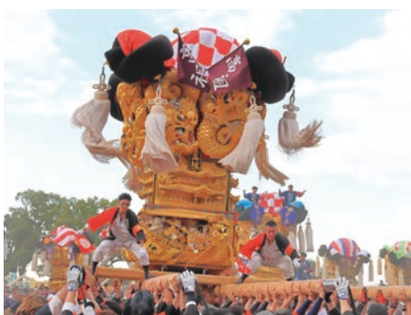
新居浜太鼓祭り