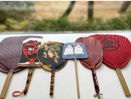
丸亀うちわ

※ スケジュール内の◎印は船外体験の下船場所です。 ※ 当日の天候・海象により、旅程(航路、錨泊地、船外体験を含む)が変更または中止となる場合がございます。