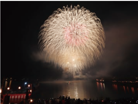
木江十七夜祭