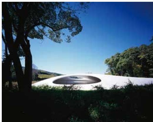
豊島美術館 Teshima Art Museum