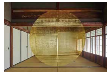
ジョルジュ・ギャラリー SHODOSHIMA2018©GEORGES ROUSSE