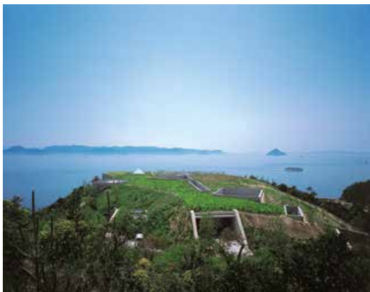
地中美術館 Chichu Art Museum