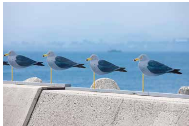
木村崇人「カモメの駐車場」 Takahito Kimura "Sea Gulls Parking Lot" 瀬戸内国際芸術祭の作品