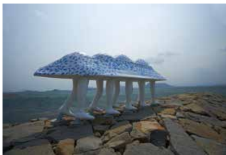
山口啓介「歩く方舟」 Keisuke Yamaguchi "Walking Ark" 瀬戸内国際芸術祭の作品