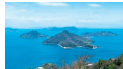
紫雲出山(しうでやま)からの眺め