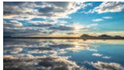
父母ヶ浜(ちちぶがはま)