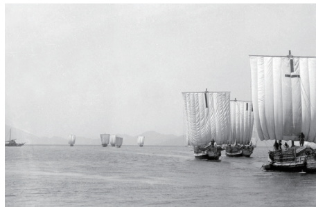
井田家旧蔵古写真・福井県立若狭歴史博物館提供