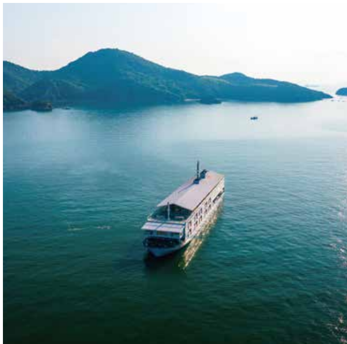
風のせとうちとガンツウ