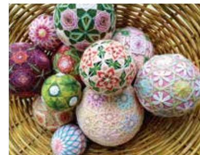
讃岐かがり手まり