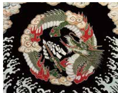
鮮やかな色彩で仕上げる讃岐のり染